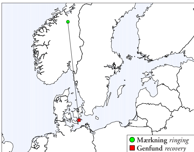
Fig. 1. Mærknings- og genfundslokalitet for jagtfalk ringmærket i udlandet og genmeldt i Danmark (n=1). Ringing and recovery site for gyrfalcon ringed abroad and recovered in Denmark (n=1).

Verdens største falk, jagtfalken, er udbredt i tundra- og taigazonen på den nordlige halvkugle, fra Nordeuropa over det nordlige Asien til Nordamerika og Grønland. I Europa yngler en relativ lille bestand, hovedsageligt i Norge, Island og Sverige. Jagtfalkene er primært standfugle, men kan optræde som strejfgæster syd for yngleområdet, bl.a. i Danmark, hvor der årligt ses 1-2 fugle (Amstrup m.fl. 2004).