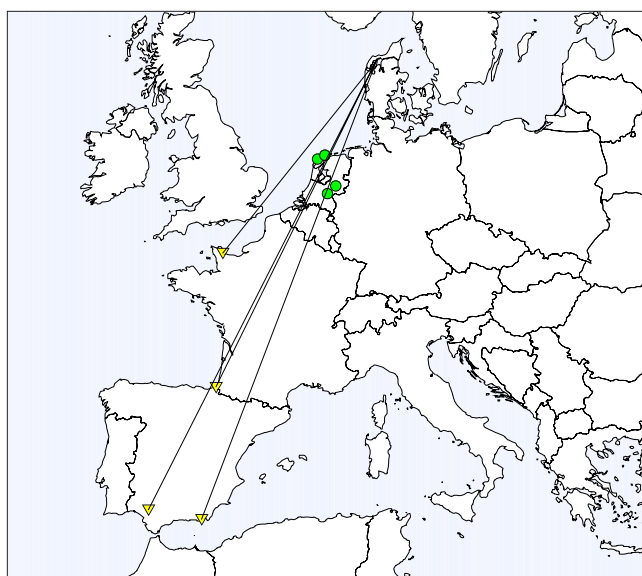
Fig. 1. Samtlige genmeldinger af skestørke mærket i Danmark (gul, n=4) samt mærkningslokaliteter (grøn, n=5) for fugle mærket i udlandet og genmeldt i Danmark. Linjer angiver direkte efterårstræk. All recoveries of spoonbill ringed in Denmark (yellow, n=4) and ringing sites (green, n=5) of spoonbill ringed abroad and recovered in Denmark. Lines indicate direct autumn migration.

Danmark huser verdens nordligste skestørke i kolonier ved Limfjorden og Skjern Å. Skestørken vendte tilbage som ynglefugl i 1996, efter 27 års fravær, og et voksende antal fugle har siden ynglet - i 2004 22 par (J. Skrivers, pers. medd.). Arten er opført på Den danske Rødliste (2004) som sårbar . Skestørkens europæiske udbredelsesområde strækker sig fra Tjekkiet og Balkan mod øst, med enkelte kolonier i Sydspanien og Holland. De hollandske kolonier havde i 2002 mere end 1.400 par (J. Skrivers, pers. medd.).