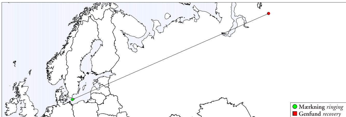
Fig. 1. Mærknings- og genfundlokalitet for sortstrubet lom ringmærket i Danmark. Linje forbinder mærknings- og genmeldingssted. Ringing and recovery site of the only black-throated diver ringed in Denmark and later recovered. Line connect ringing and recovery site.

Der foreligger kun én genmelding, men den er til gengæld ret bemærkelsesværdig. Det drejer sig om en førsteårsfugl, som 13. november 1968 blev mærket i farvandet vest for Bornholm og 15. september 1970 blev skudt på Sibiriens tundra, 3759 km mod nordøst (fig. 1). Hovedparten af de nordrussiske fugle menes at overvintre ved Sortehavet og Det Kaspiske Hav, men denne genmelding viser altså, at i det mindste nogle nordrussiske fugle opholder sig i Østersøen allerede i november, eventuelt for at drage videre mod sydligere vinterkvarterer (Cramp & Simmons 1977). Ellers er de sortstrubede lommer kendt for et sløjfetræk (se kap. 4), idet sibiriske fugle overvejende trækker til Sortehavet, men om foråret lægger vejen omkring Østersøen pga. den sene ismeltning i indlandsområderne (Salomonsen 1967).